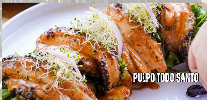
PULPO TODO SANTO