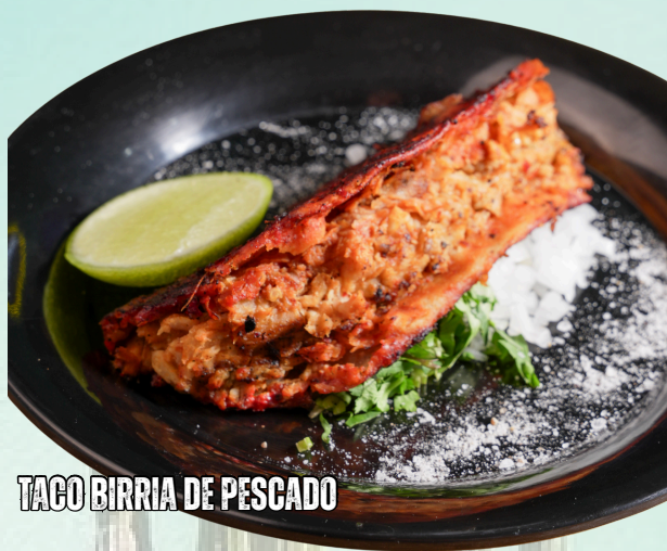
TACO BIRRIA DE PESCADO

PESCADO GUISADO EN SALSA BIRRIERA CON SU OREGANITO Y CEBOLLA.