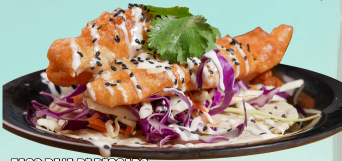
TACO BAJA DE PESCADO