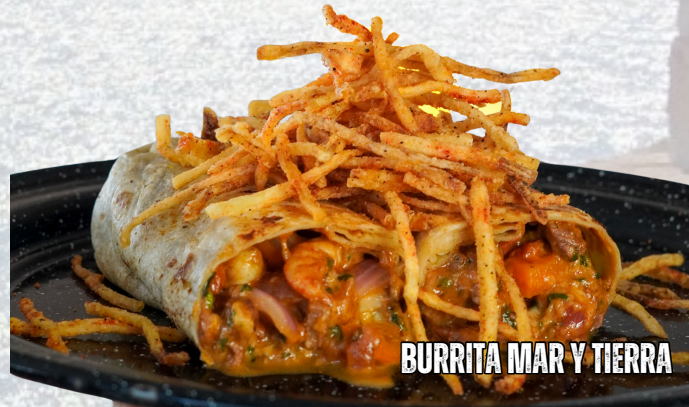
BURRITA MAR Y TIERRA

BURRITA MAR Y TIERRA $155 DE CAMARÓN Y ARRACHERA CON PICO DE GALLO Y QUESO. TORTILLA GRANDE DE HARINA