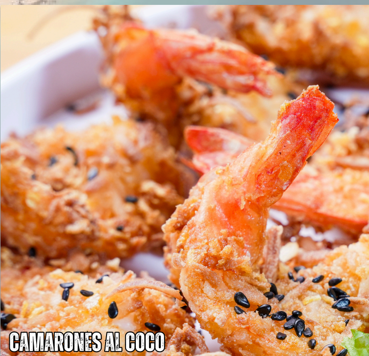
CAMARONES AL COCO