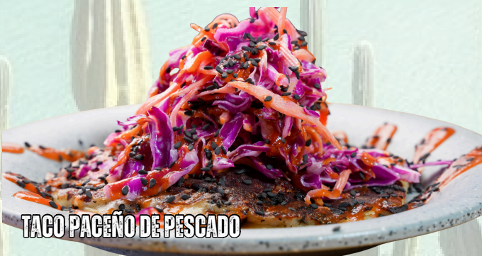
TACO PACEÑO DE PESCADO