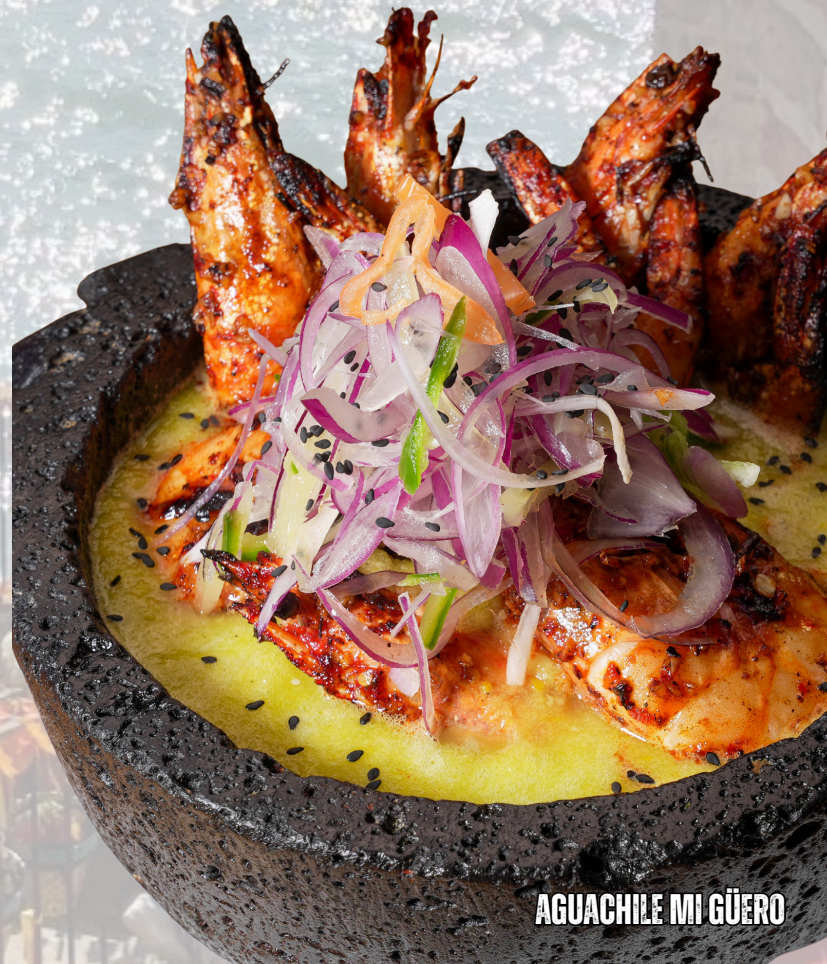
AGUACHILE MI GÜERO

AGUACHILE MI GÜERO NUEVO $299 CAMARONES ASADOS CON AJO EN AGUACHILE AMARILLO CHILACO!!