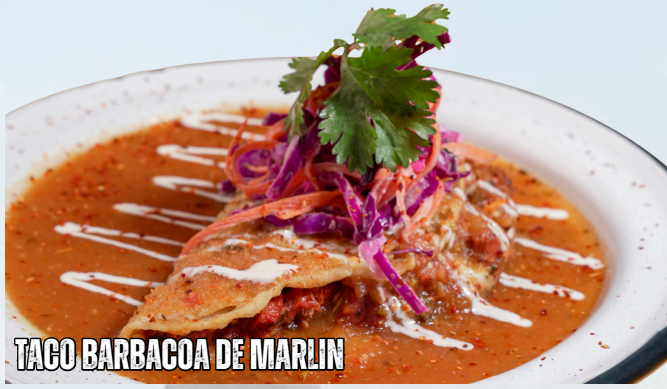
TACO BARBACOA DE MARLIN

TACO BARBACOA DE MARLIN NUEVO $55 DORADITO Y AHOGADO EN SALSITA.