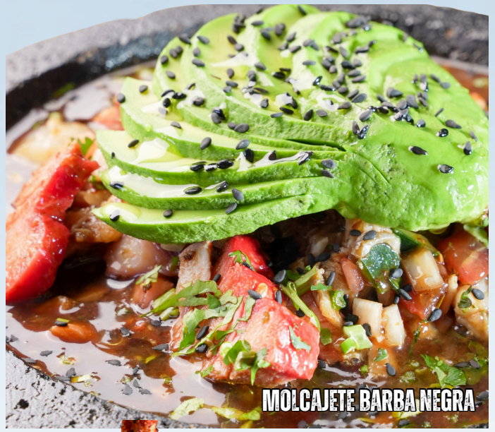
MOLCAJETE BARBA NEGRA

ARRACHERA, CAMARÓN Y VEGETALES A LA PARRILLA, BAÑADO EN SALSA MORITA Y MEZCAL, PERFECTO PARA COMPARTIR