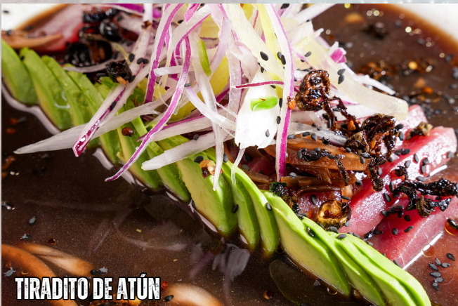
TIRADITO DE ATÚN

TIRADITO DE ATÚN $235 LAMINADO, EN SALSA ORIENTAL Y AGUACATE. ESTA DELICIOSO!!